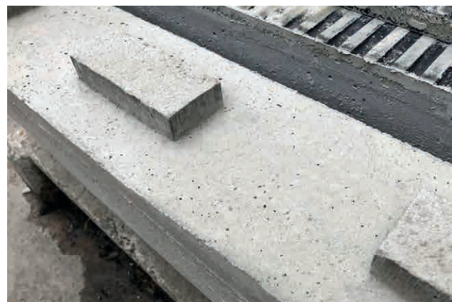
Halteklötzchen aus faserverstärkten Beton.